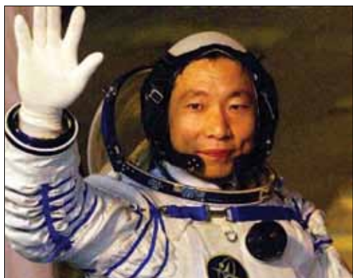
Yang Liwei, første taikonaut på en rumflyvning.

des har Kina allerede succesfuldt gennemført to missioner til Månen med de to rumsonder Chang'e-1 og Chang'e-2, der har kredset om vores nærmeste nabo i rummet. En kinesisk rumsonde til Mars, Yinghuo 1, blev sendt af sted som passager på den russiske Phobos-Grunt-mission i november 2011. Desværre nåede missionen dog aldrig ud af kredsløb om Jorden, men brændte i stedet op i Jordens atmosfære i januar i 2013.