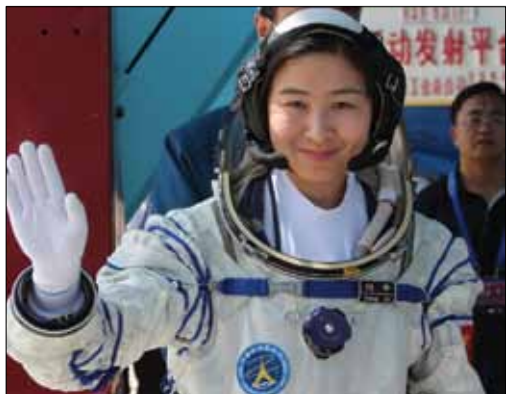
Liu Yang, første kvindelige taikonaut på en rumflyvning.

modulet skal brænde op i Jordens atmosfære. Med erfaringer fra brugen vil kineserne omkring 2020 realisere en stor, modulopbygget rumstation.